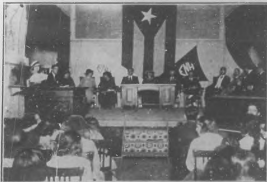
Presidencia del homenaje tributado al culto pedagogo Sr. Pérez Raventós por la Asociación de Alumnos de las Escuelas Normales.

En el brillantísimo homenaje rendido por los alumnos de la escuela número 3 a su amado director, el reputado pedagogo señor Ramón Rosainz, con motivo de celebrar el quincuagésimo aniversario de su dedicación al Magisterio, nuestro estimado amigo el no-