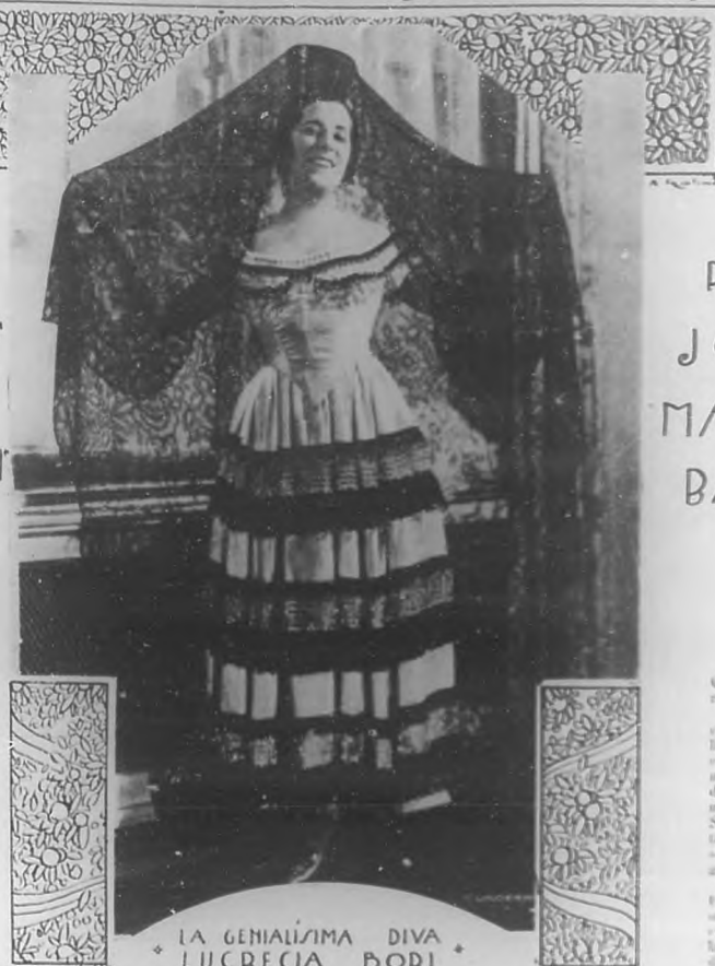
LA GENIALÍSIMA DIVA LUCRECIA BORI