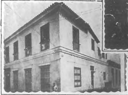
EDIFICIO DEL BANDO DE PIEDAD