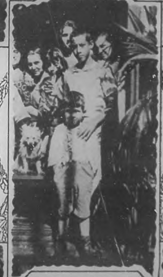
UN GRUPO DE ASILADOS