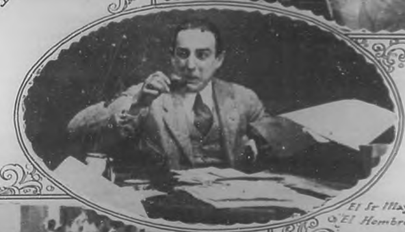
El Sr. May en El Hombre Mecánico .