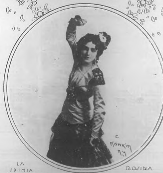
LA PRIMA BALLARINA