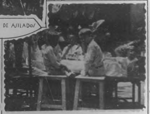
DURANTE LA MERIENDA