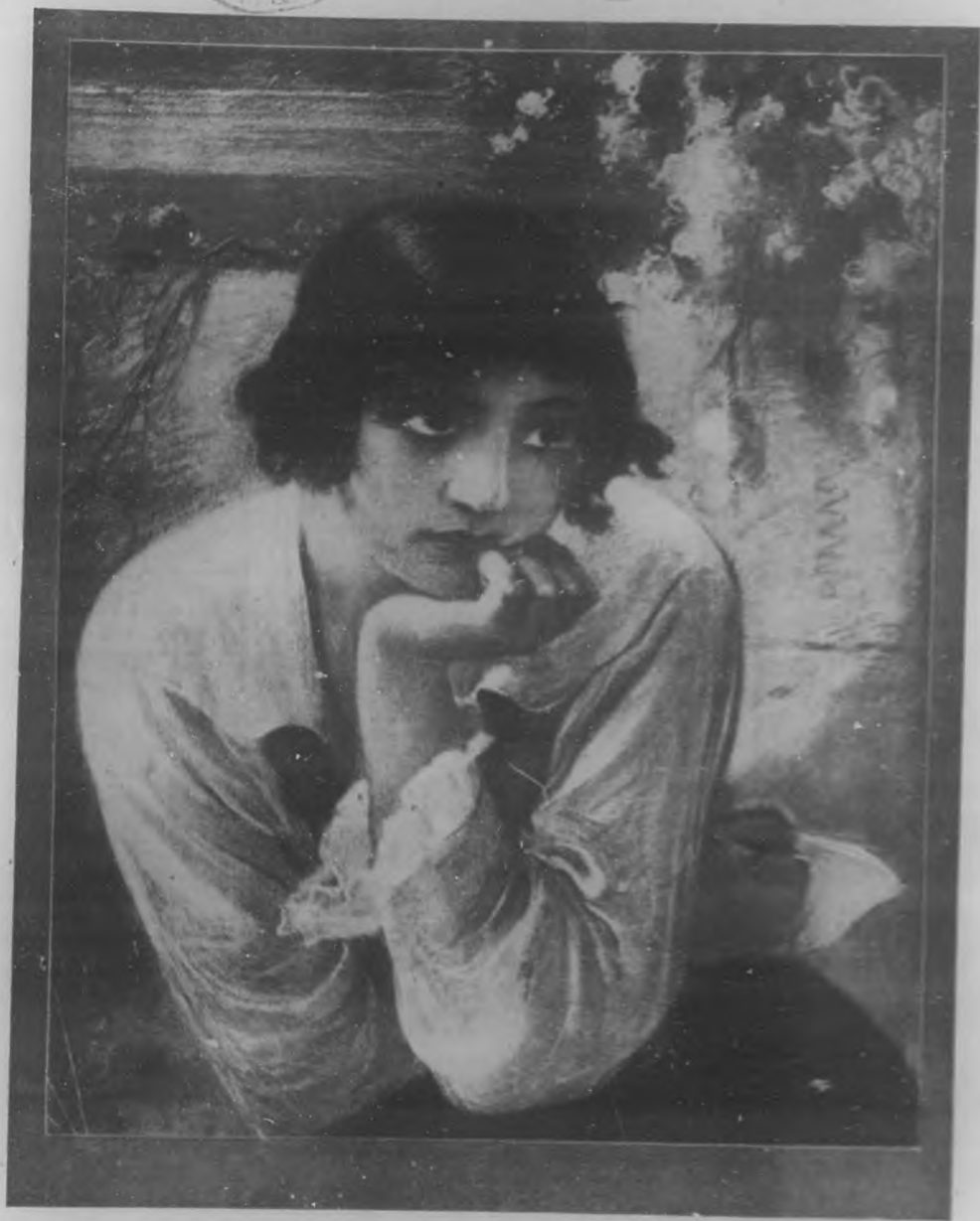
LA CARTA Cuadro de Julio Borrell.