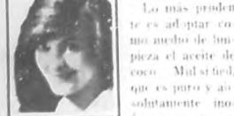
PRISCILLA DEAN Fama actriz del Cine.

Si quiere usted conservar su cabellera, tenga cuidado con el uso de los jabones. La mayoría de los jabones y champús preparados contienen seleniato alcalí. Este destruye el cuero cabelludo, haciendo el cabello frágil y quebradizo.