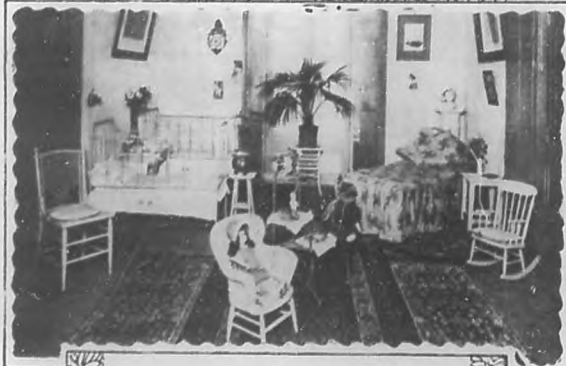
DORMITORIO DE BABIES

El Ayuntamiento de la ciudad de la Habana le ha conferido el título de hija adoptiva con una medalla honrosa distinción por la cual está ella muy halagada, pero que no basta. La posteridad debe conocer a esta mujer de alma gigantesca. Y para perpetuar su nombre y estimular