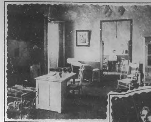
DISPENSARIO PARA NIÑOS

Desde la entrada se advierte que la piedad invade y domina. El pequeño local que sirve de oficina, recibidor y saloncillo de espera,