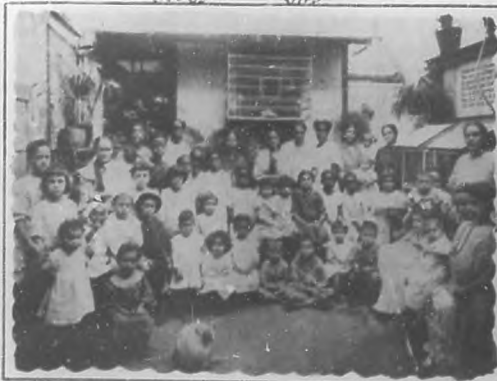
ASISTENTES A LA CONSULTA DEL DISPENSARIO PARA NIÑOS DOBRES

Ciertamente aquella pequeña puerta del Bando de Piedad, se abre a todas horas para el necesitado... y también para que por ella salga en todo tiempo