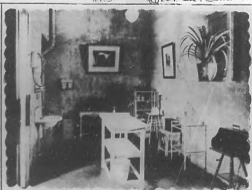
SALA DE CONSULTAS DEL DISPENSARIO PARA PEQUEÑOS ANIMALES.

con su ejemplo debía erigirse una estatua en cuyo pedestal haya un símbolo único del altruismo y con una inscripción que exprese en pocas palabras lo que ha sido para la humanidad, este ser excepcional. La estatua simbólica ha de ser de tal magnitud que para su erección de ben celebrarse tres concursos: de escultores, de pintores y de pensadores.