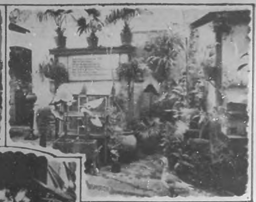
PATIO DE LA CASA

está adornado con cuadros que muestran cabezas de animales y estas frases se leen en distintos lugares: "No otros hablamos por los que no pueden hablar por sí mismos"; "Odia el delito y compadecete al delincuente".