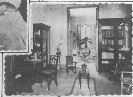
BIBLIOTECA AL FONDO DORMITORIO PARA NIÑOS