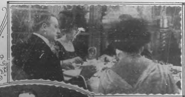
El Sr. May en La leyenda de la Laguna .